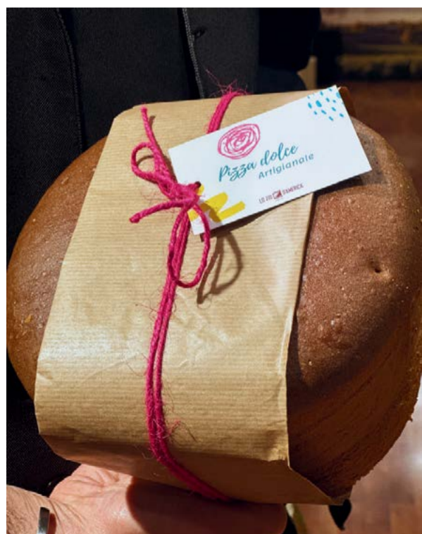
Pizza Dolce 900 g € 13,90