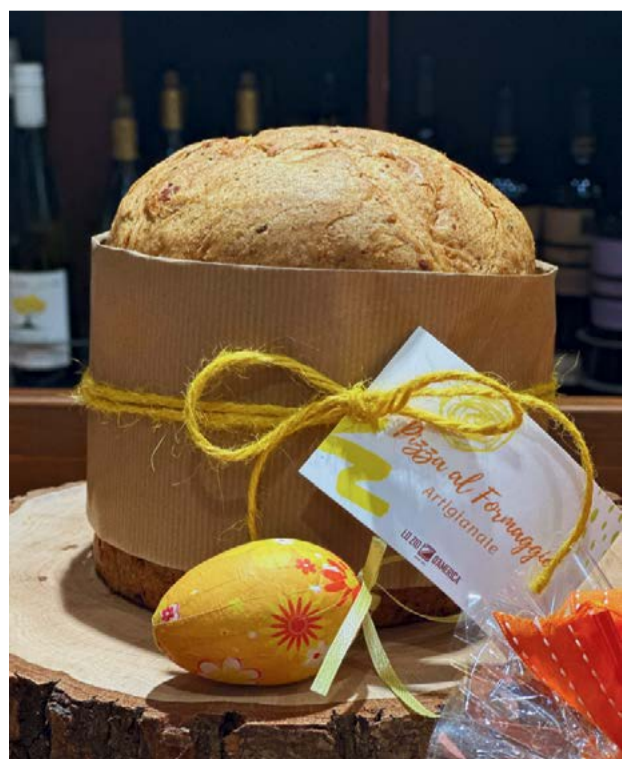
Pizza al Formaggio 500 g € 10,90