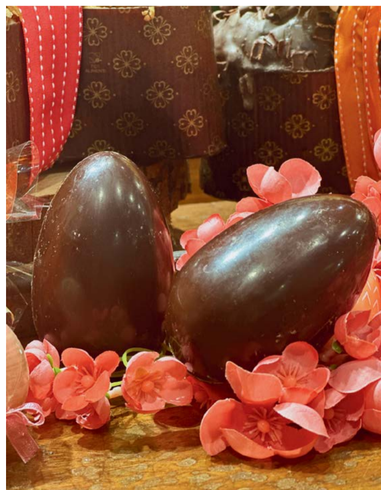
Uova Artigianali da € 8,70