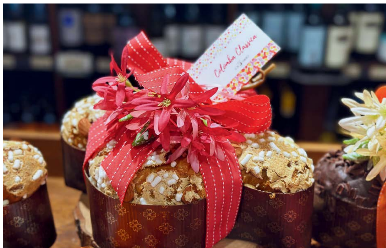
Colomba Classica 1 kg

Con la collaborazione di Maestri artigiani abbiamo realizzato Colombe, Uova di Cioccolato e Pizze Pasquali utilizzando solo materie prime di pregio, nel rispetto della tradizione enogastronomica dello Zio d'America.